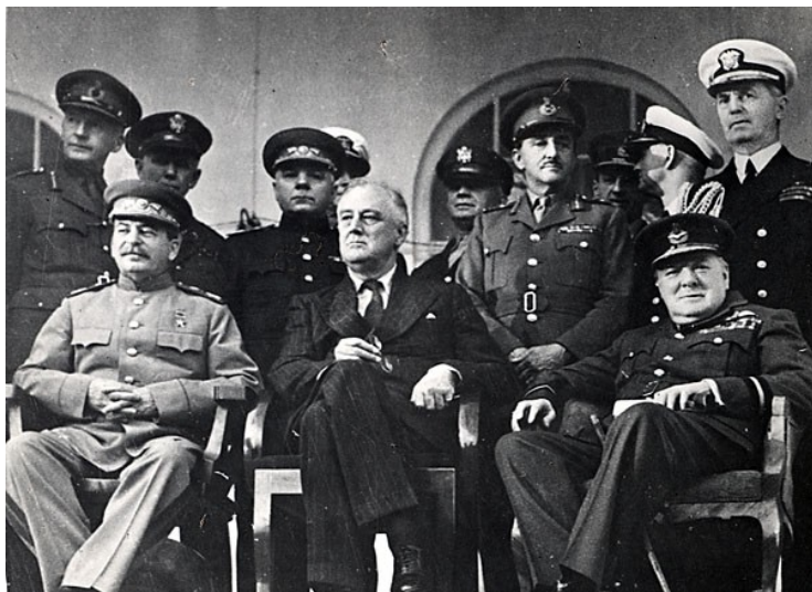
Dokonce na této fotce je vidět, že Roosevelt a Stalin jsou spolu, a Churchill sám bokem.

„V listopadu 1943 Churchill přijel do Teheránu v civilním oděvu, ale když spatřil Stalina v maršálské uniformě, objednal si urychlené doručení své vojenské uniformy královských vzdušných sil. A do konce konference chodil jen v ní. Jednání byla složitá. Řeč šla o termínech otevření Druhého frontu, směřování hlavních úderů a množství ozbrojených sil spojenců v těchto úderech. Došlo to do toho, že Stalin řekl Vorošilovovi: „Ztrácíme tu marně čas!“ Ale dohoda byla přece jen dosažena. Na závěrečném obědě, sedě mezi Stalinem a Rooseveltem, si Churchill pomyslel: Napravo ode mě je velký sibiřský medvěd, zleva americký bizon a já jsem malý anglický oslík, který jediný zná správnou cestu. Během konference dostal infarkt, začal zápal plic a srdeční záchvaty: bylo spotřebováno příliš mnoho nervů a vykouřeno doutníků!» 1